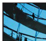
Technické zařízení budov