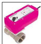
Kulový kohout Směšovač Potrubní technika