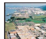
Průmysl Chemie Farmacie