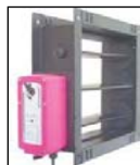
Regulační klapka Uzavírací klapka Odtahová klapka