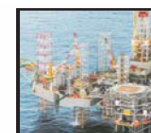
Offshore Onshore Lodářství