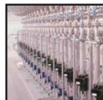
Lakování Vysoušení Síla