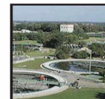
Skládky čistírny odpadních voda